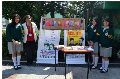
Escuela Secundaria General 271 "Riviera Oriental" Toluca, México. Foto: Margarita Pascasio y los alumnos Piedad Nolas, Luciana Rojas y María Elena, integrantes del Club de Lectura.